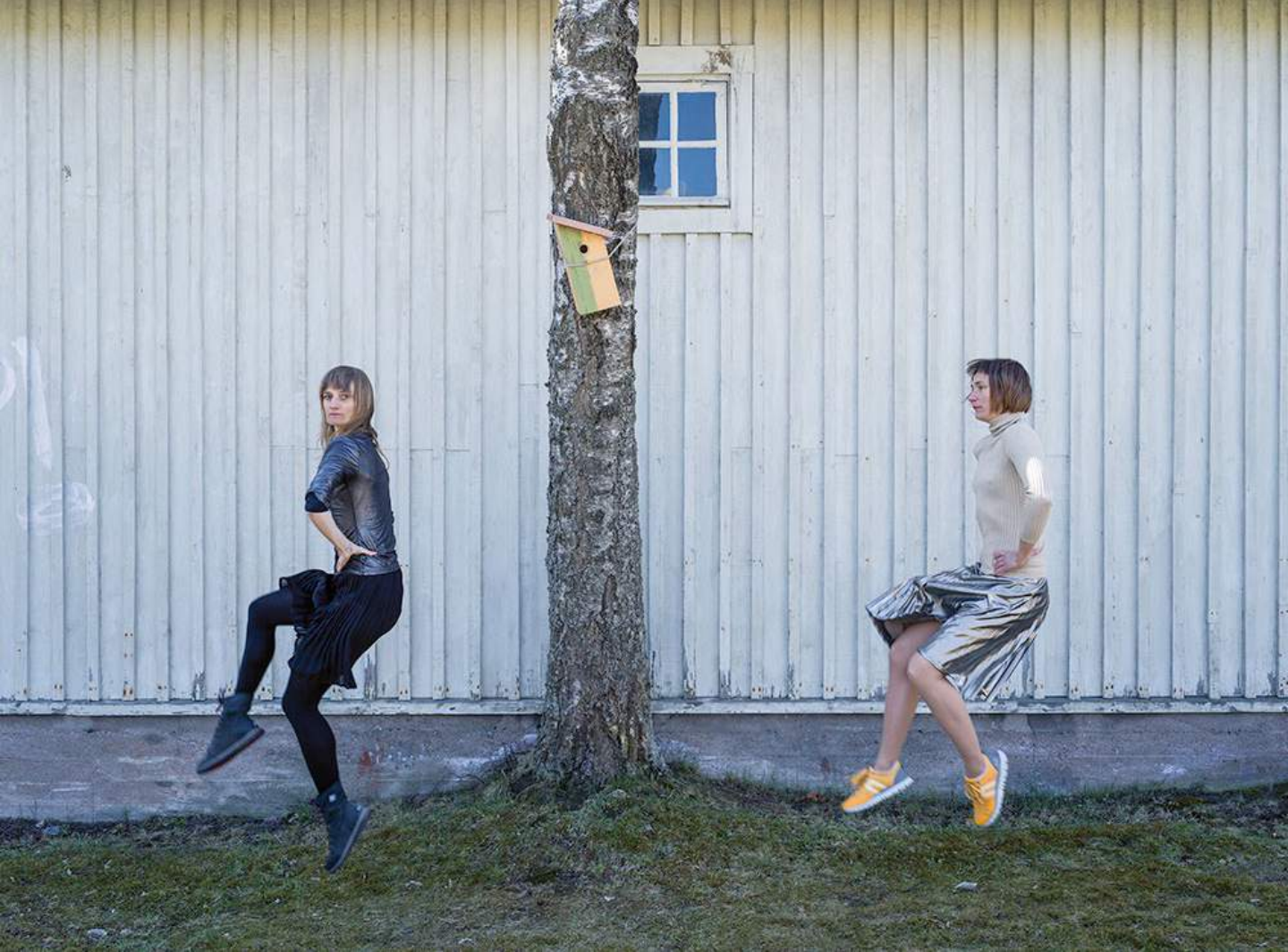
Elina Brotherus, Passing Music for a Tree , 2017