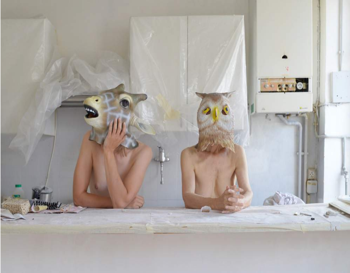
Elina Brotherus, Giraffe and Owl , 2013

Les images d'Elina Brotherus, photographe et vidéaste finlandaise, jouent sans cesse avec les règles de ce jeu qui peut aussi s'écrire « je » et qui passe, sans se lasser, du mot au vu, du vu au poème, du poème à tout ce qui dans le cadre peut rire en silence. Elina se met en scène dans ses photographies en travaillant autant la mise en abîme que la dérision. Elle voyage ainsi avec désinvolture de l'autofiction au regard sur le paysage, de la réappropriation de l'histoire de l'art à des inventions formelles mêlant image fixes et images en mouvement. Alors oui, le travail d'Elina Brotherus racontent des histoires qui pourraient s'apparenter à des contes oubliés. La fable d'une balle rouge saisie dans son envol pour Baldessari Assignements (2016- ), celle des femmes seules de la maison Carré (2015-2018) et la comptine éternelle de l'artiste et son modèle qu'elle module à foison en se dédoublant.