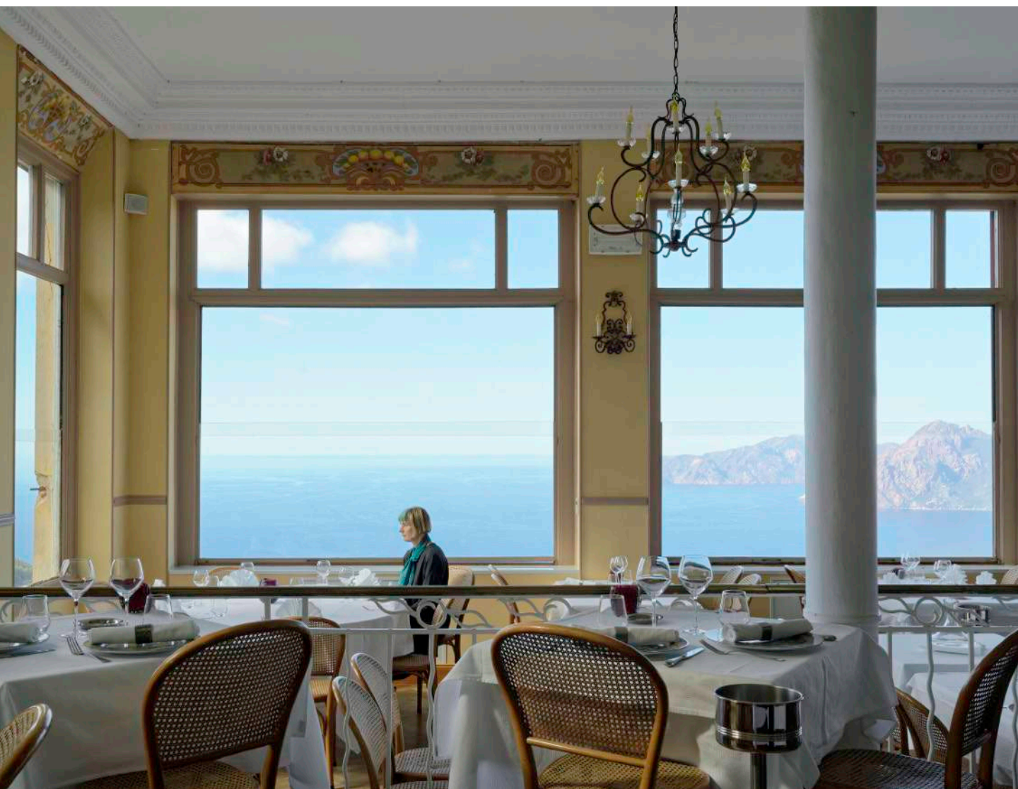
Elina Brotherus, Hotel de Sebald 2 , 2019

Exposition du 3 juillet 2021 au 12 septembre 2021 aux Cales 2 Créateurs