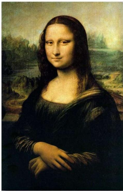
Léonard de Vinci, Mona Lisa , 1503 - 04 et 1510 -15.

Passons donc en revue quelques représentations de portraits ancrés dans notre imaginaire collectif :