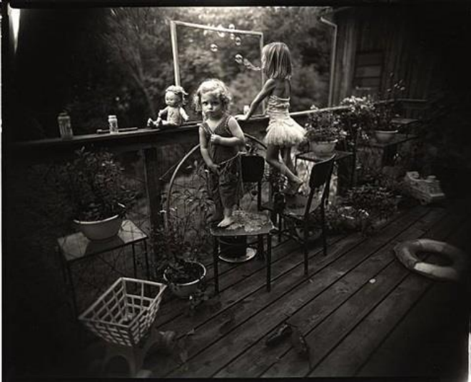
Sally Mann, Blowing bubbles , 1987.