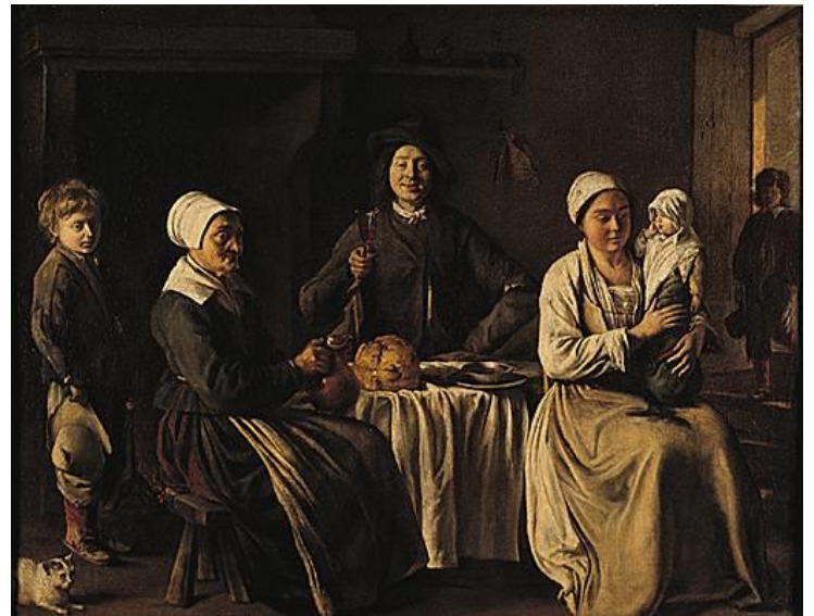
Louis Le Nain, Famille de paysans , 1642.