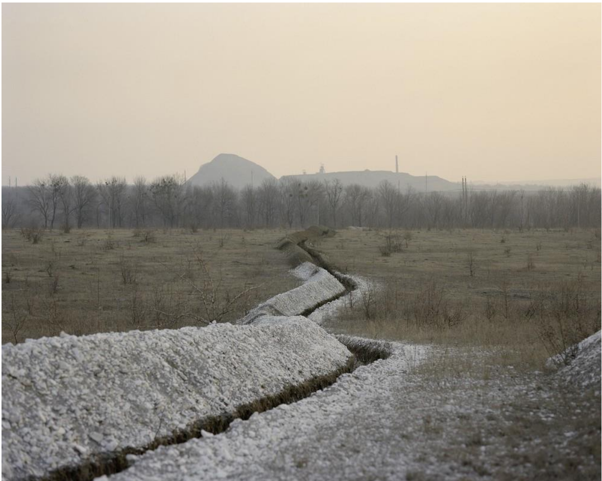
Wiktoria WOJCIECHOWSKA, Trenches , extrait de la série « Sparks », 2015.